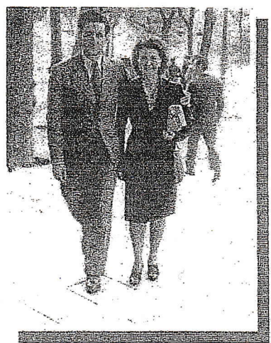
Madrid, mai 44