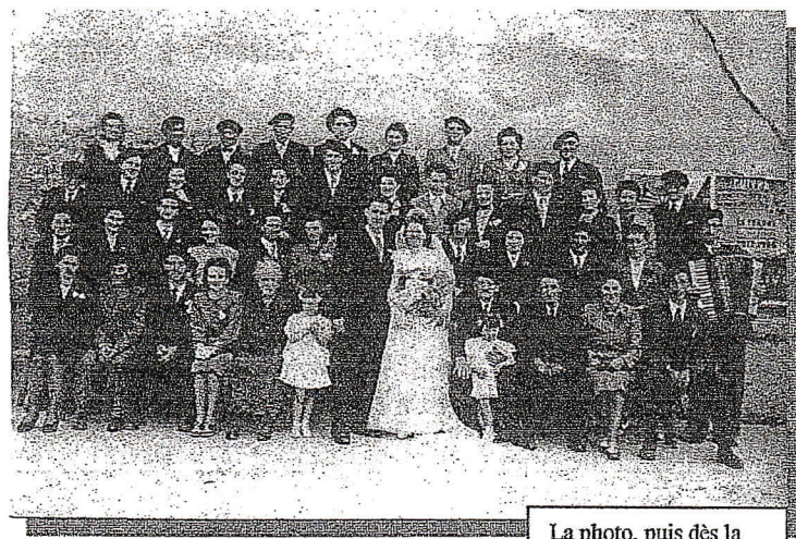
La photo, puis dès la nuit tombée, l'exil vers l'Espagne.